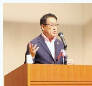
青木英二目黒区長のご挨拶