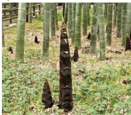
すずめのお宿緑地公園