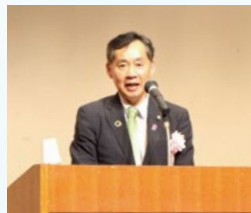
鈴木まさし目黒区議会議員のご挨拶