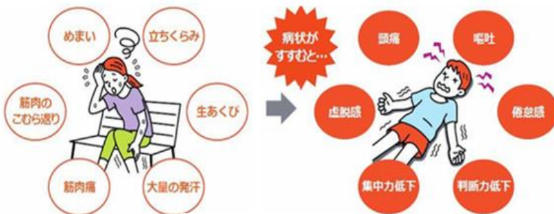
厚生労働省『熱中症予防のために』